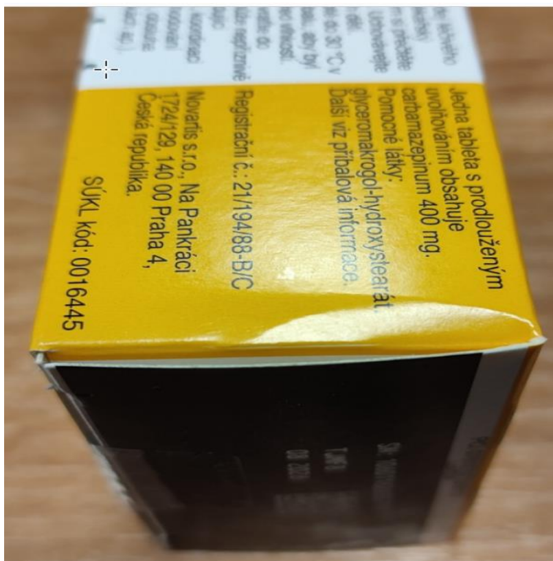
Obrázek: Ilustrační fotografie balení s estetickou vadou na sekundárním obalu šarže TJMF8