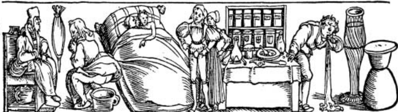
Purgierung. Verstopfung. Geburtwerck. Sam. Zän artzney. Trunckenheyt. Byer.